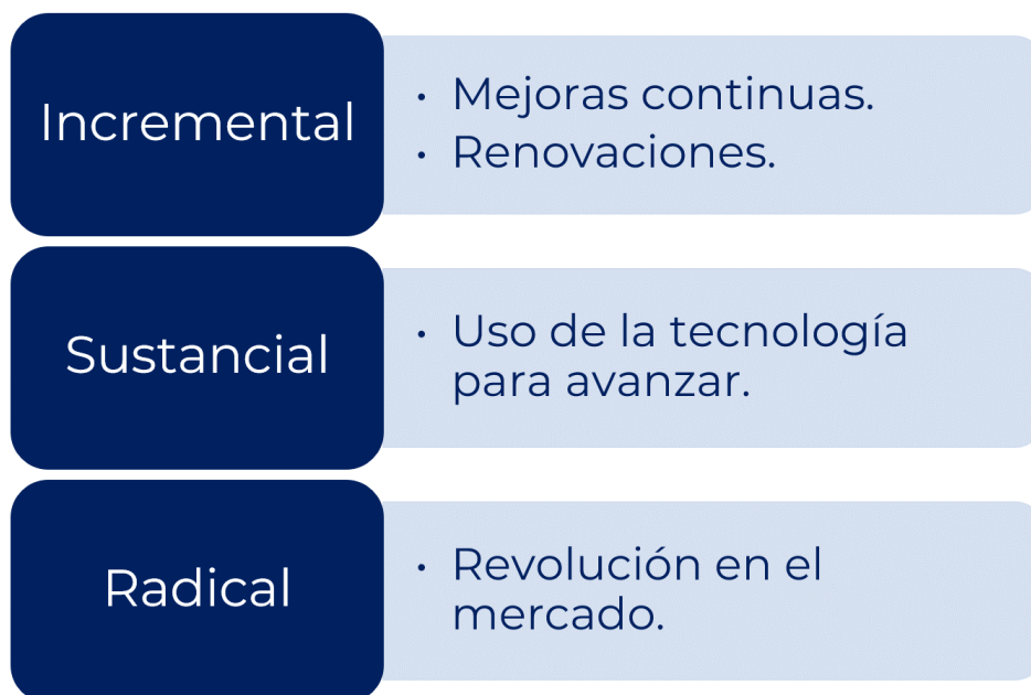
Figura 5. Tipos de innovación.