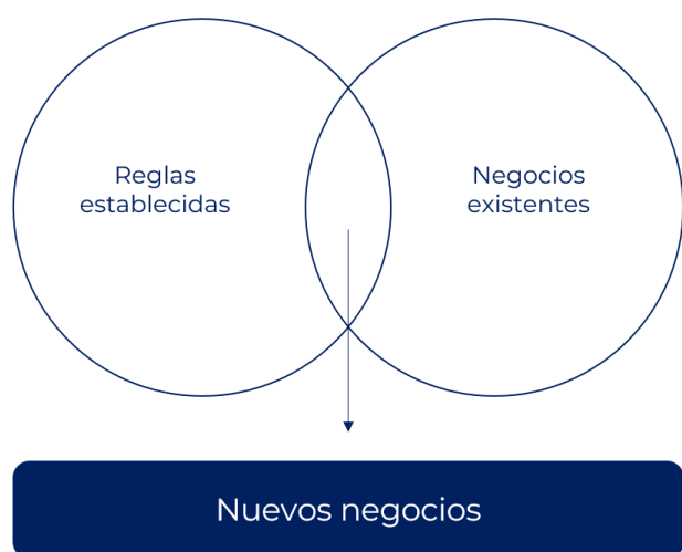
Figura 1. Nuevos negocios.