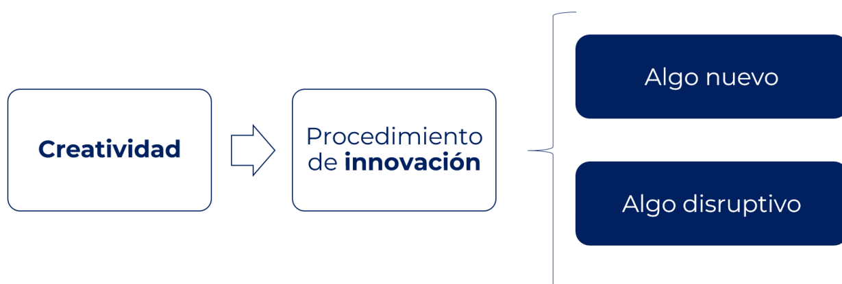
Figura 3. Ilustración conceptual de los conceptos mencionados.