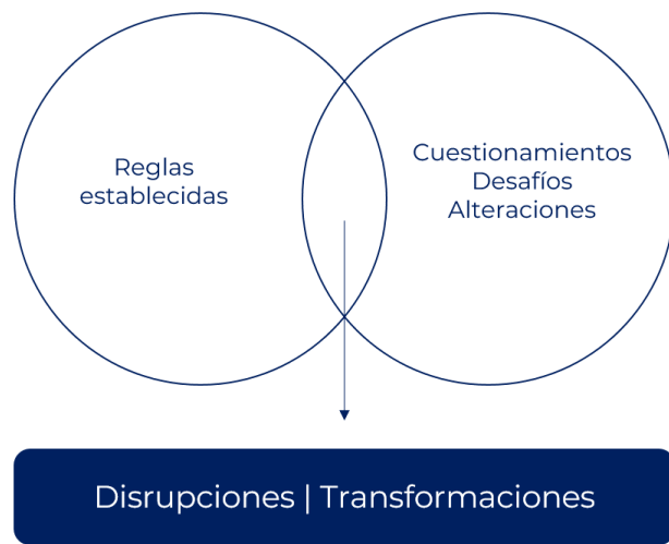
Figura 2. Disrupciones.

Para situarse en posición, la persona puede empezar con las siguientes preguntas: